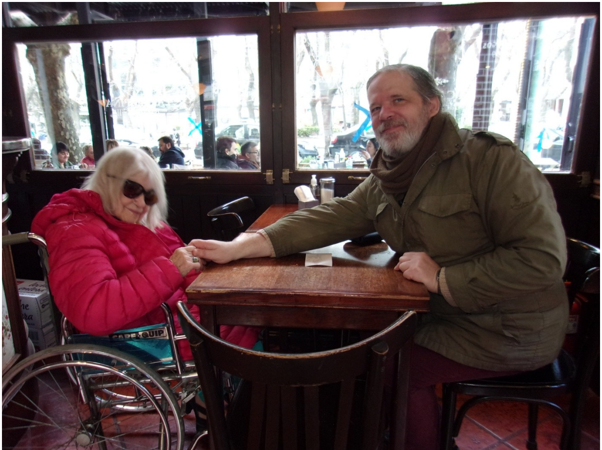
Buddha Maitreya and his mother celebrating his first 100 books published in just over 3 years in a restaurant.

It is living in the absence of the ego, in unity with the Totality. And within this transformation, what are we? Simply what Is, the Infinite.