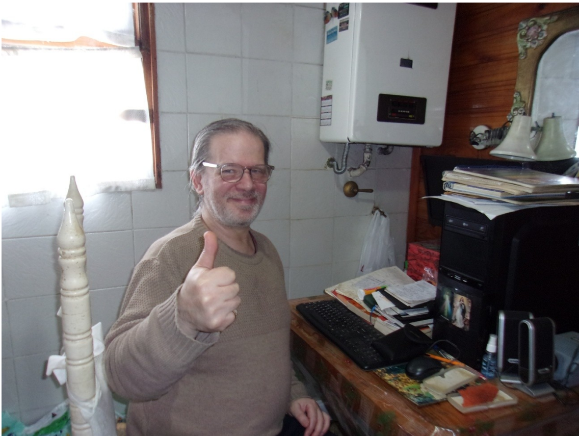
RG at his meager desk set up in the small kitchen of his mother's apartment