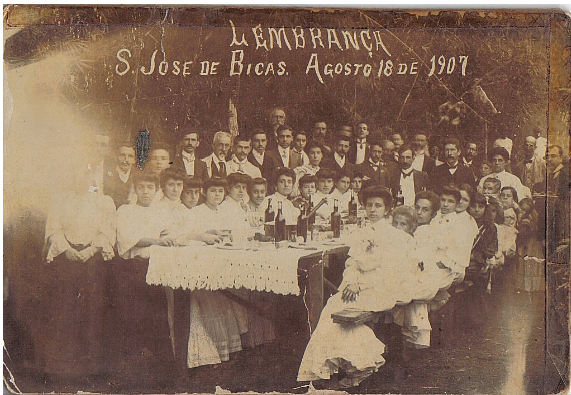
Foto familiar de la estancia de mi bisabuelo