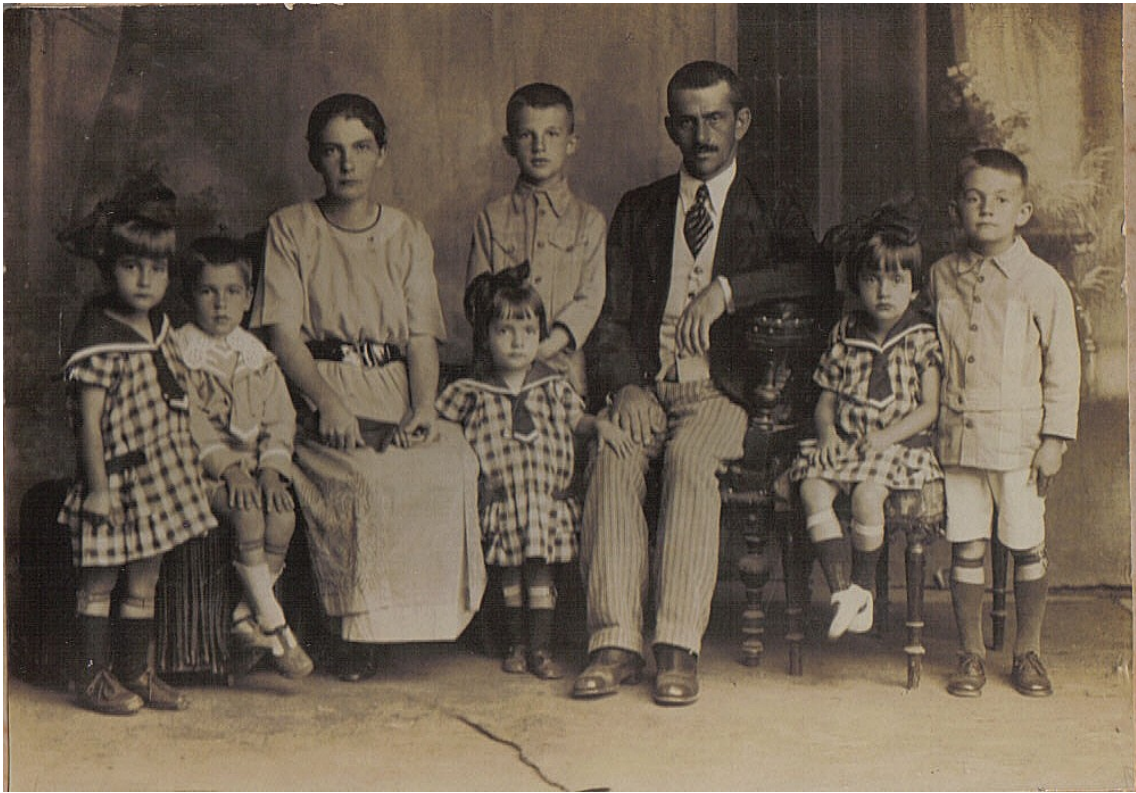
Foto familiar de mis abuelos en Minas Gerais